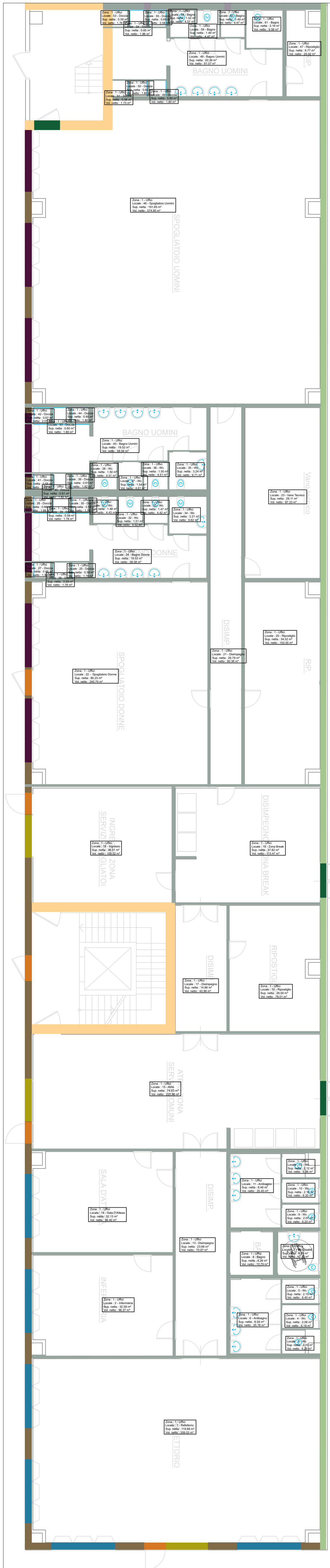
PIANO TERRA - Uffici - Scala 1:100