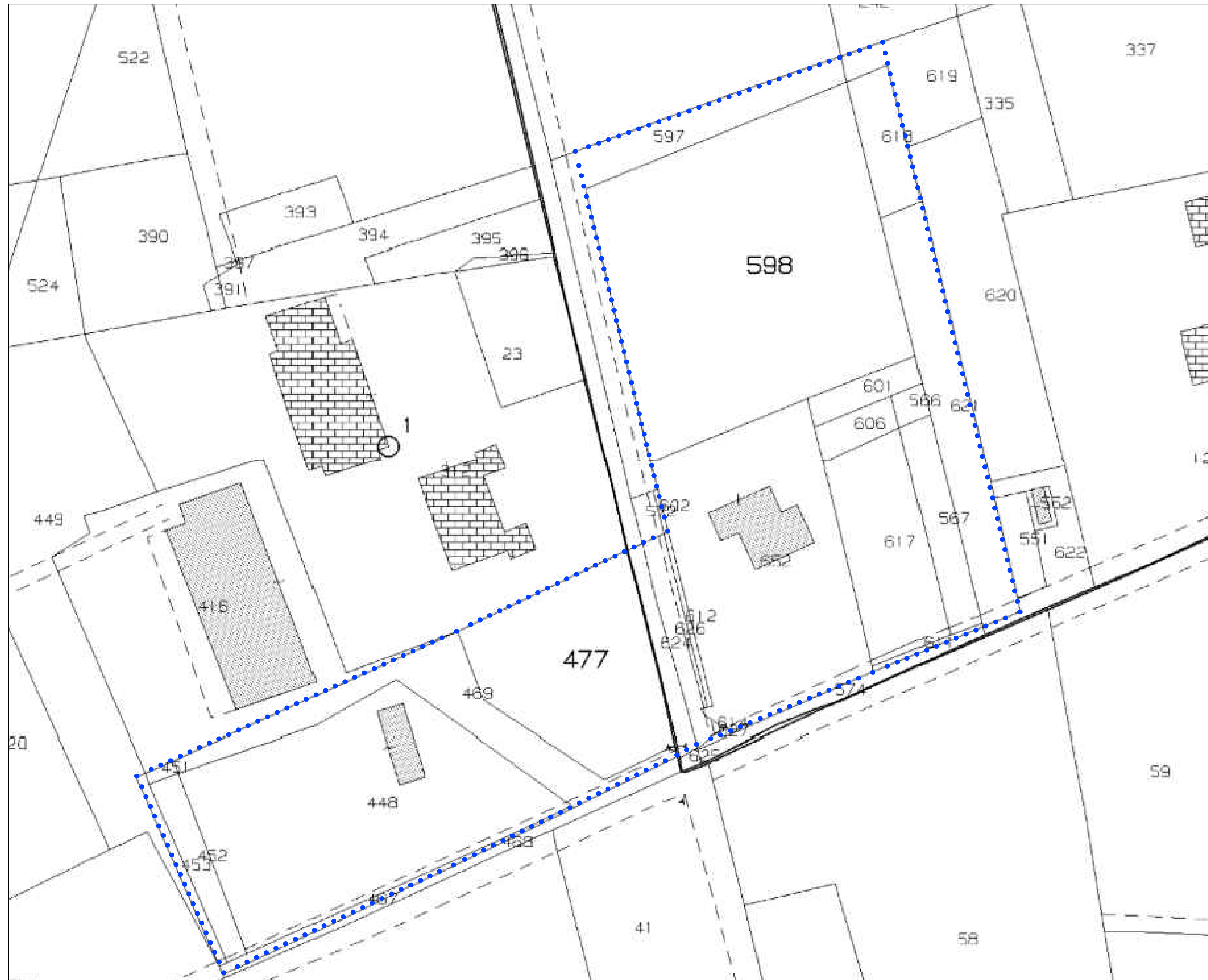
Estratto di mappa catastale